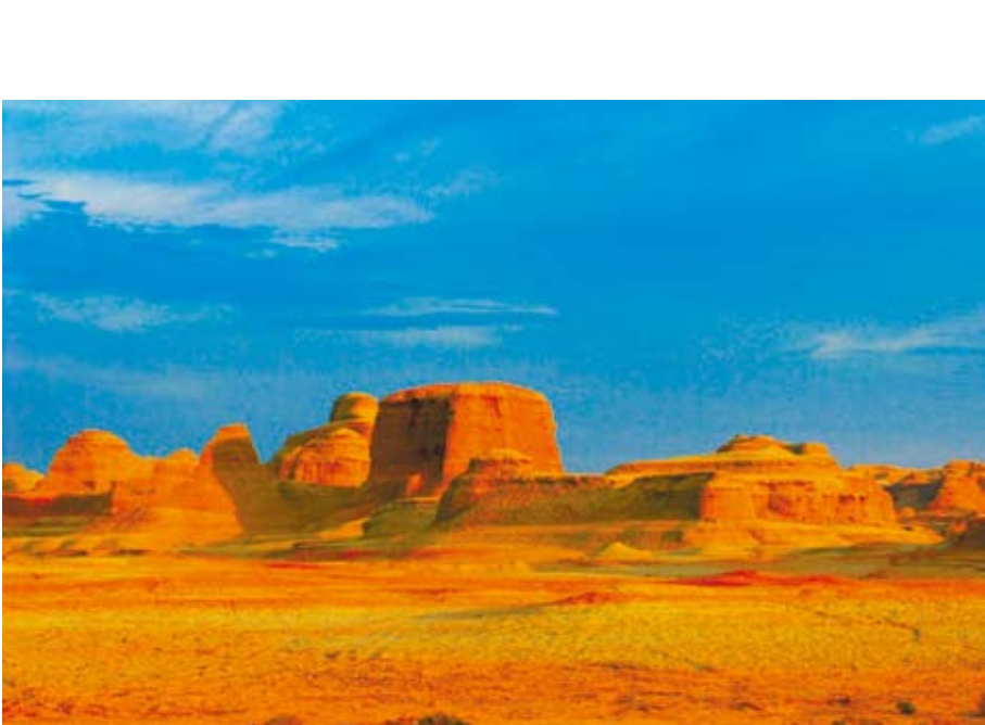
魔鬼城又稱烏爾禾風城，擁有各類風蝕地貌組合，形態萬千令人目不暇接。