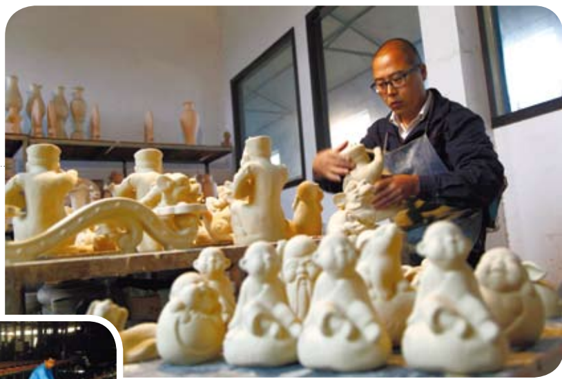
河南寶豐：中小企業助力鄉村經濟發展。圖為河南省寶豐縣大營鎮汝瓷製作產業園，一名技術工人在製作汝瓷。

長遠看，經濟運行的品質和效率還會得到顯著提升。 增長速度換擋期、結構調整陣痛期、前期刺激政策消化期——中國大陸經濟正處於「三期疊加」的特殊階段，經濟增速也在由高速增長向中高速、中低速增長轉型，一些原來因高速增长掩蓋的問題將會在這個週期集中暴露。 在這種新常態之下，對那種經濟下行壓力一增大，就寄望政府頒布刺激政策的論點和做法是一種短視，對中國大陸經濟的長遠發展並無裨益。 正如大陸國務院總理李克強在2014夏季達沃斯論壇所說，「看中國經濟，不能只看眼前、看局部、看單科，更要看趨勢、看全局、看總分。」在經濟增速放緩的情況下，今年1至8月，大陸31個大中城市調查失業率保持在5%左右，城鎮新增就業970多萬人，與去年同期