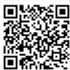
拜訪兩岸犇報的網頁