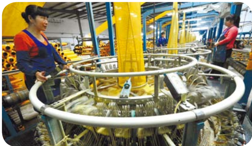
山西運城農民成中小企業蓬勃發展主力軍。圖為運城市新絳縣黨頭村農民工在山西天力塑膠有限公司編織車間工作。