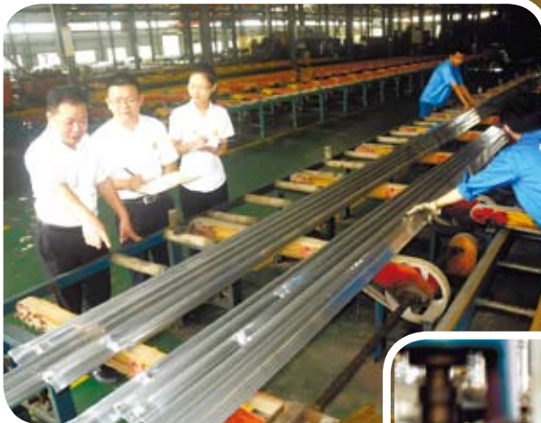
金融助力中小企業。圖為中國農業銀行江西安義縣支行工作人員在中小企業雄鷹鋁業公司瞭解企業生產情況和產品市場前景。

從今年10月1日至2015年底，月銷售額2至3萬元的大陸中小企業也將納入暫免徵稅範圍。同時，對於年納稅所得額低於6萬元的中小企業，其所得減按50%計入應納稅所得額。金融機構與中小企業借款合同亦將免征印花稅 本次大陸對待中小企業的政策將免稅範圍從2萬元提高至3萬元，看似減稅的規模不是很大，但政策的輻射面很廣。如果按一個中小企業10個人計算，減稅政策將涉及十倍甚至更多人的就業和稅收。 本次大陸對於中小企業財稅支援政策可以用「立體、全方位」來形容，不僅減稅還在此前頒布的中小企業免徵22項行政事業收費的基礎上，進一步減免了中小企業「雜費」支出，例如對吸納就業困難人員就業的中小企業，給予社會保險補貼，高校畢業生到中小企業就業，由市、縣公共就業人才服務機構免費保管檔案。可以說，相比此前側重稅收的扶持，這次政策注重從「授人以魚」向「授人以漁」轉變，這是建立中小企業扶持長效機制的標誌。