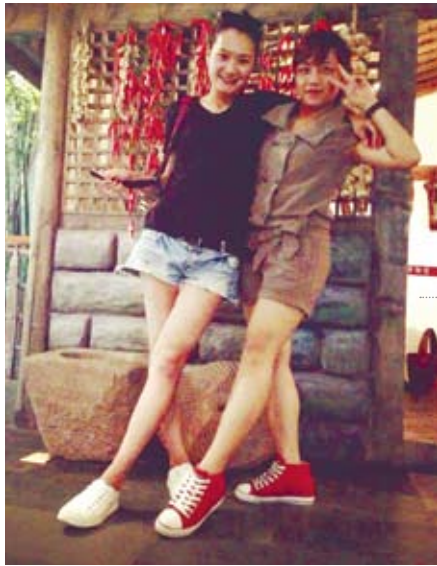
重慶辣椒也要有辣妹配才夠辣，這是在長江博物館的場景。

的旅程會很無聊。幸好，這十一天，每個人都變成了我的朋友，真的玩的很開心。這是我第二次造訪北京了，這次特別有感覺，我們是被幸運之神所眷顧！感謝上天，在這五天的行程中給我們一個很棒的天氣，北京很涼爽。