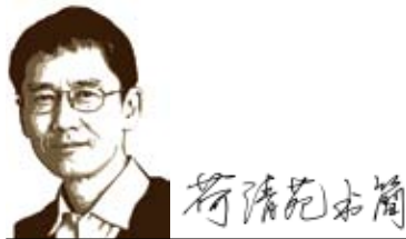
與台灣青年朋友的通信