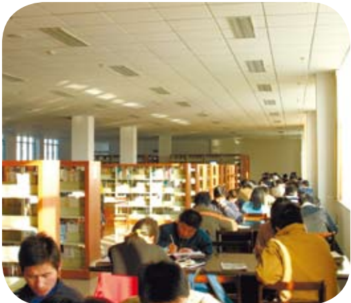
學習要活，不能死學，一個重要的內容應就是為感興趣而學。

一個人能做什麼，適合做什麼，恐怕不是他所學習的專業所能唯一確定的。人的職業多少還是為著生活而奔波。事實是，人們經常為著生活，不得不做著自己不是特別喜歡或合適的職業。有時，現實似乎是無奈的。也因此，現在不少人提出人們應該早些從第一個、多少是為著生活的職業退休下來，這樣可以開拓真正自己感興趣的工作（職業）。從這個角度言，年輕時候因感興趣而學習到的知識，似乎就是一個必須了。這樣，當他退休時，這些知識就能大大豐富他的退休後的生活了，或還能開拓他的事業的第二春呢。