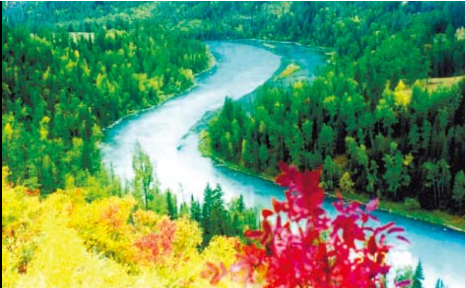
喀納斯被譽為神的後花園，美麗的「S」字河灣蜿蜒於河谷間，讓硬朗的山景平添了幾分嫵媚。