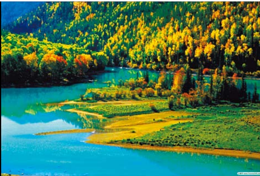
位於北疆的「喀納斯」是新疆最早見秋色的地方。