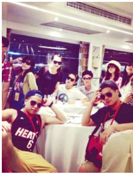
我們終於搭上了長江遊輪——維多利亞凱蒂號，我們紛紛想像自己是夢幻巨星。(圖／王雪如)